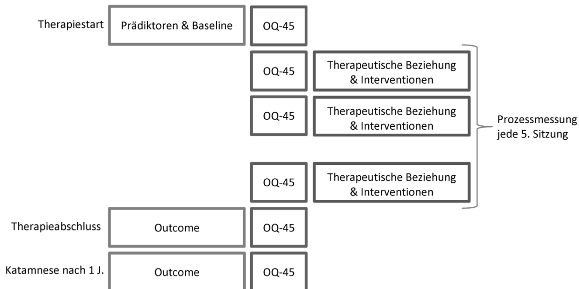
Abbildung 1: Schematische Darstellung Designs PAP-S-Studie